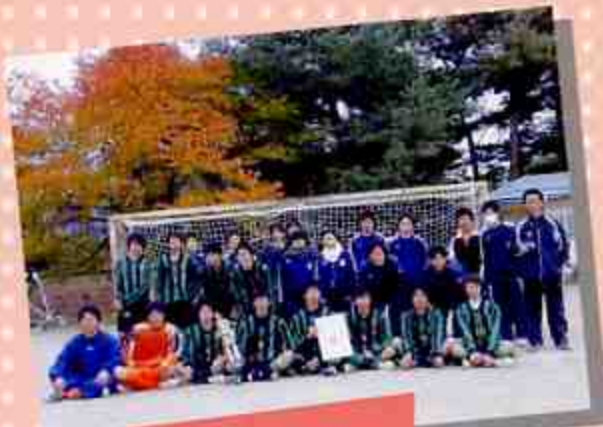
サッカー部 新人戦北信大会 優勝 2008年11月