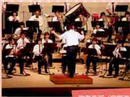
吹奏楽部 (定期演奏会)

吹奏楽 音楽 室内楽 美術 演劇 JRC 生物 地学 科学 数学 英語 文学 写真 将棋 茶道